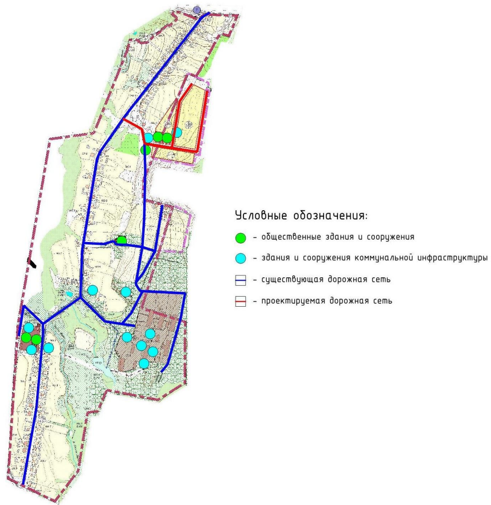
Рисунок 2. Существующая и проектируемая дорожные сети д. Суккул-Михайловка.